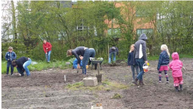
Plant- en zaaiochtend

Het achterste deel is een gezamenlijke moestuin waarbij ook kinderen betrokken worden bij het onderhoud. Het voorste deel is een gezamenlijke pluktuin met ruimte voor activiteiten. Er zijn in 2016 enkele schoolklassen op bezoek geweest, zo hebben onder andere een klas van de Kubus en van het Anker geholpen met water geven van de groenten en de kinderen hebben geleerd over de groenten en het fruit dat er staat. Vooral de aardbeien werden erg gewaardeerd door de kinderen.