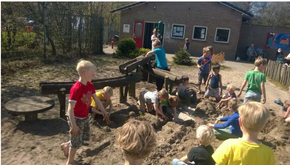
Zand en water

De speeltuin is vooral in de maanden mei, juni en juli veelvuldig bezocht door groepen (inschatting ca. 15 keer), zoals schoolklassen, kinderopvang en welzijnsorganisaties, zowel vanuit de wijk als andere delen van Amersfoort. We doen dan altijd de deur van het gebouw open, zodat gebruik gemaakt kan worden van de toiletten en er water ter beschikking staat.