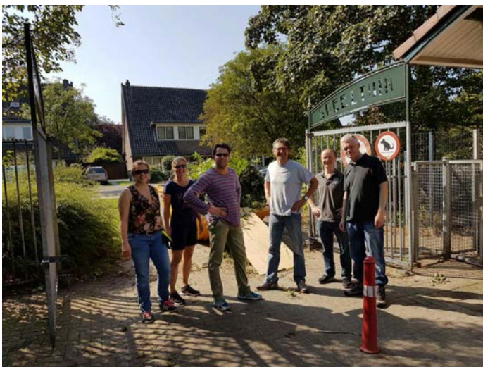
Klussen met vrijwilligers van Twijnstra Gudde