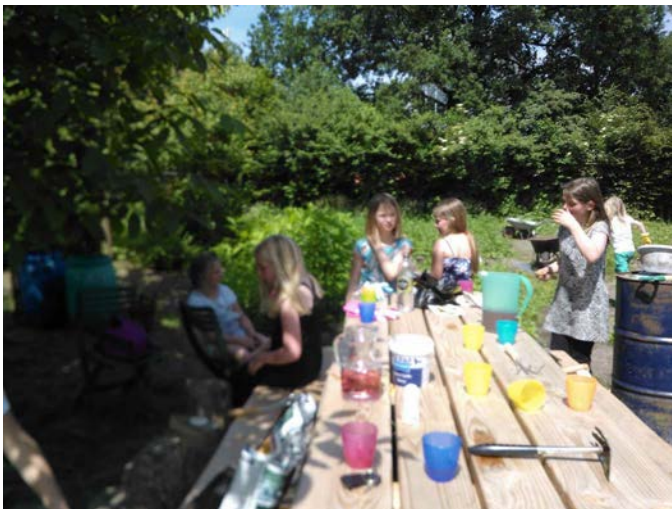
Schoolklas van de Kubus helpt in de moestuin

Het achterste deel is een gezamenlijke moestuin waarbij ook kinderen betrokken worden bij het onderhoud. Het voorste deel is een gezamenlijke pluktuin met ruimte voor activiteiten. Er zijn in 2016 enkele schoolklassen op bezoek geweest, zo hebben onder andere een klas van de Kubus en van het Anker geholpen met water geven van de groenten en de kinderen hebben geleerd over de groenten en het fruit dat er staat. Vooral de aardbeien werden erg gewaardeerd door de kinderen.