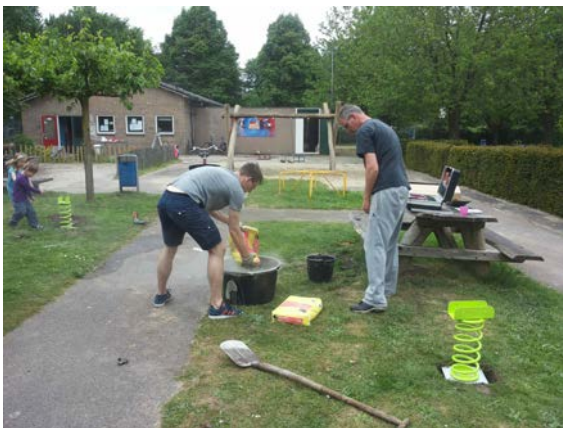
Nieuwe wipkippen plaatsen